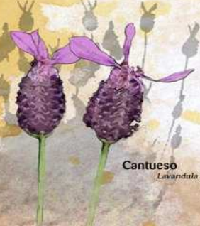
Cantueso Lavandula stoechas