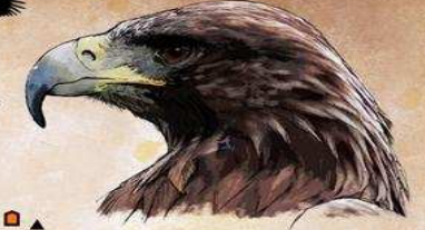
Palacio de las Cabezas Las Cabezas 326